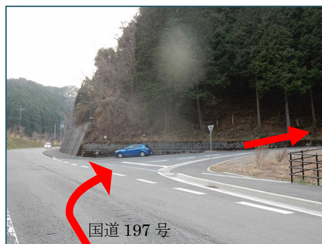
須崎方面から見た交差点

※T字路交差点を右折してください ※壁地トンネルやラーメン豚太郎まで行くと行き過ぎです