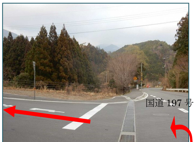
梶原方面から見た交差点