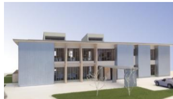
高知県森林組合連合会事務所