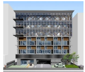
高知県自治会館新庁舎