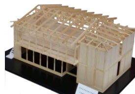
窪津漁業協同組合事務所