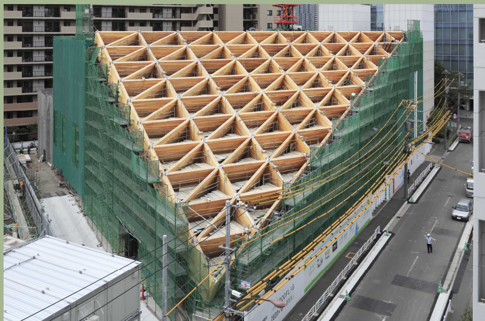
ROOFLAG—設計:原田真宏+原田麻魚

CLT建築推進協議会では全国のCLT建築に携わる有識者をお招きしてフォーラムを開催しています。